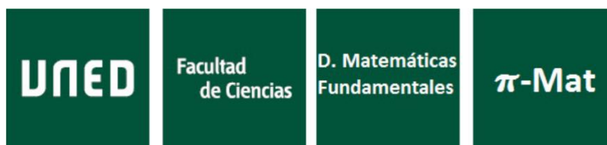
Figura 1. Logo del Grupo de Innovación Didáctica \pi -Mat.